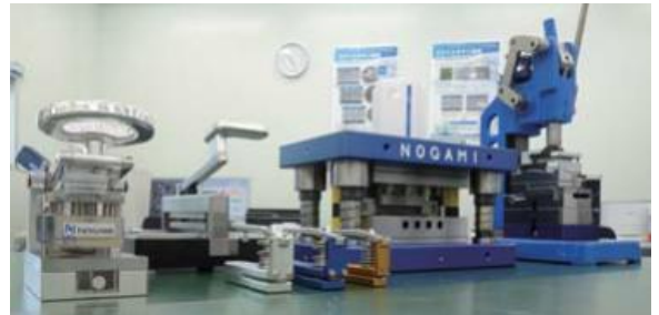
開発したプレス機シリーズ